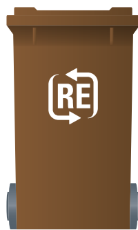
Braune Tonne Bioabfall