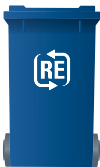
Blaue Tonne Papier, Pappe, Karton