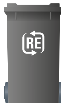
Graue Tonne Restabfall