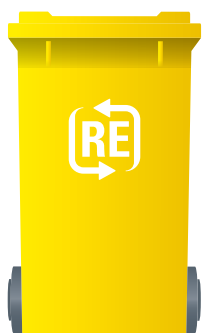
Gelbe Tonne Verpackungen

Die Wertstofftonne wird viel diskutiert. In manchen Regionen ist sie bereits im Einsatz und hat dort die Gelbe Tonne abgelöst